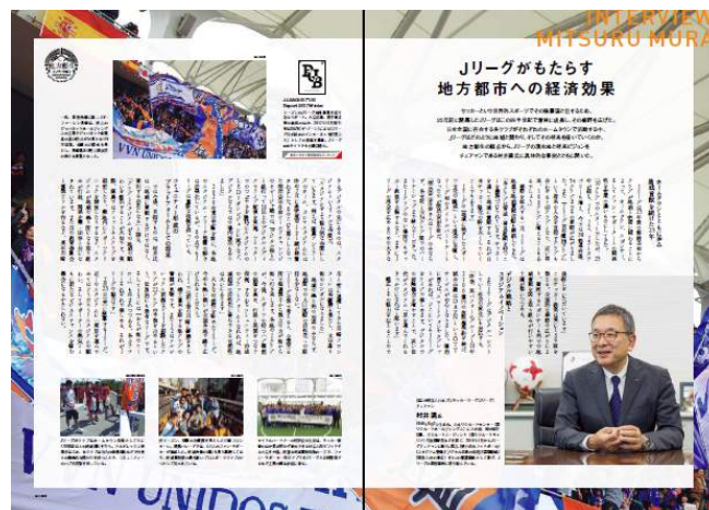
地方創生特集にて Jリーグチェアマン村井満氏の 巻頭インタビュー