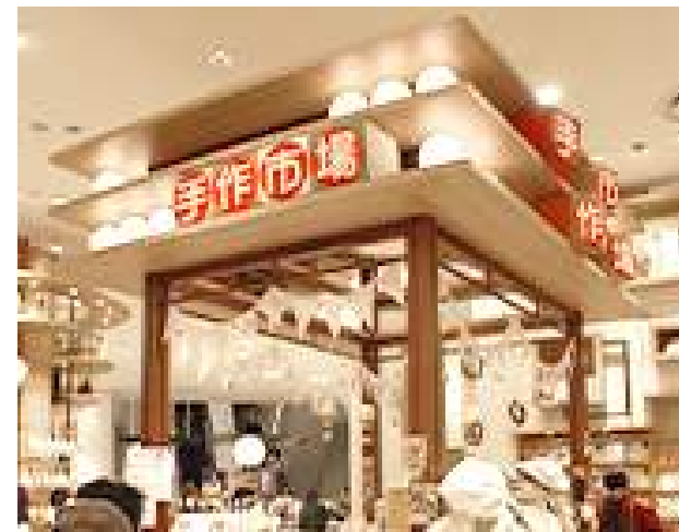
コムースタイル運営の 「手作市場」の売り場